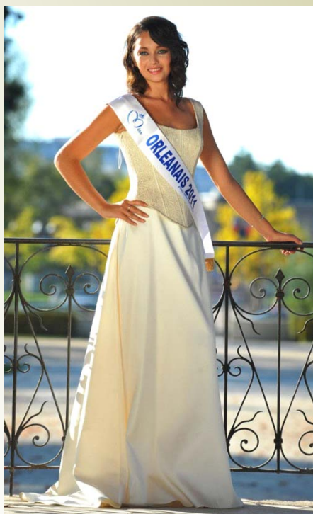
Miss Orléanais 2011 Miss Eure-et-Loir 2011 Miss Pays de Combray 2009