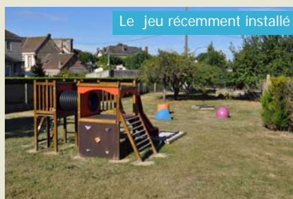
Le jeu récemment installé