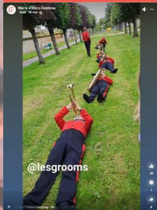
25 et 26 mai - Mon Village en fête