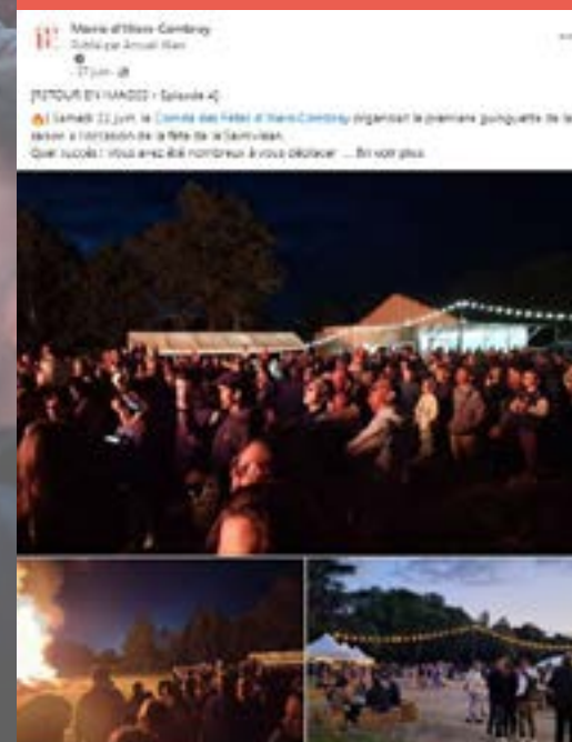
24 juin - Feux de St Jean