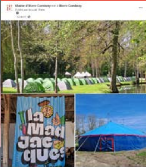
13 avril - La MadJacques