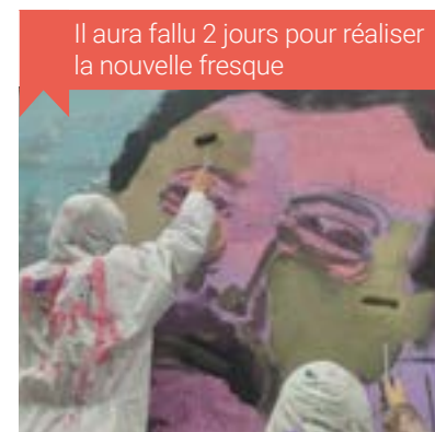
Il aura fallu 2 jours pour réaliser la nouvelle fresque