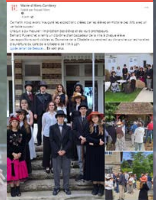
8 juin - Vernissage expositions