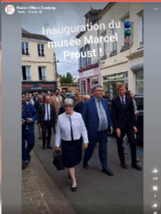
16 mai - Inauguration Musée Marcel Proust