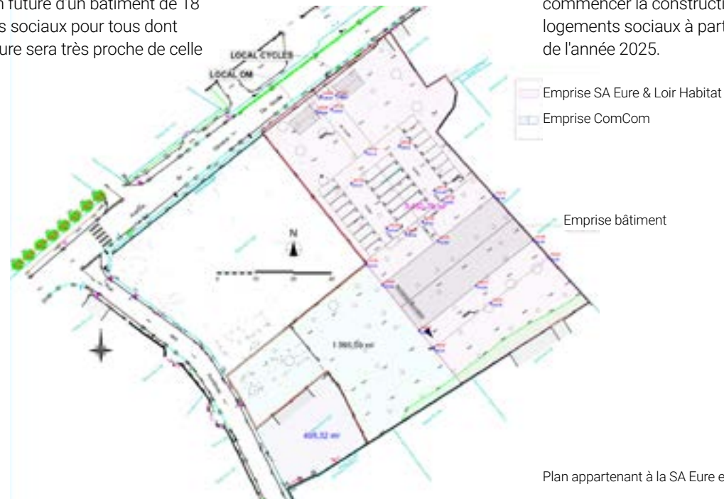
Plan appartenant à la SA Eure et Loir Habitat

Lors du premier projet, les phases de diagnostics et d'analyses avaient révélé des traces de pollution liées aux anciennes activités industrielles. Les travaux de dépollution du site sont désormais terminés. Les permis de construire seront délivrés d'ici l'été. La SA Eure et Loir Habitat, déjà propriétaire des Euréiales, pourra commencer la construction des logements sociaux à partir de la fin de l'année 2025.