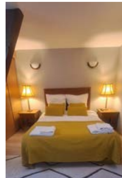
Couleurs peps et vue sur l'église Saint-Jacques donnent envie de prolonger le séjour.